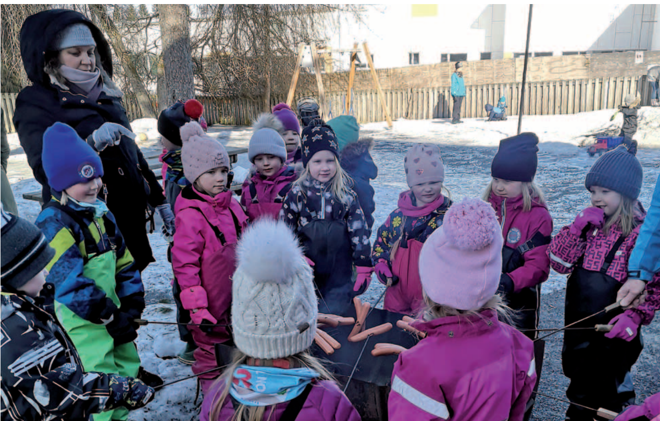
Päiväkotiryhmät olivat ottaneet mukavasti vastaan kutsun tulla ulkoilemaan seurakuntatalon pihapiiriin. Li- säksi mukaan saapui lapsia vanhempien ja isovanhempien kanssa.