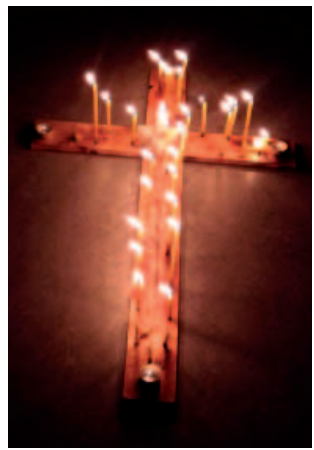
Poikkeusharjun leirikirkossa on tunnelmallista saada ensimmäinen ehtoollinen.

Viime kesänä ripille pääsyt Elisa Rinneheimo pitää käytäntöä hyvänä.