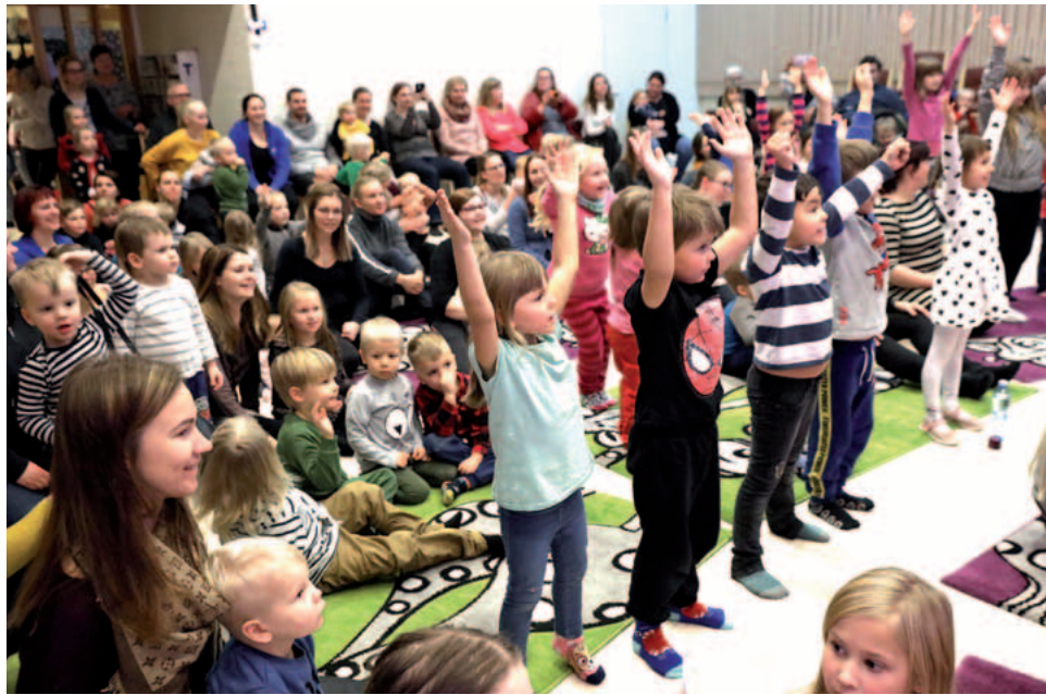
Vanhempien on tärkeää tuoda lapsiaan seurakunnan tapahtumiin.

Kodit joutuvat kamppailemaan vaatimusten alla. On jaksettavat harrastaa ja liikkua, ja lapsille on luettava. Nukkua pitäisi kymmenen tuntia yössä. Mistä voimat tällaisen tavoitteen saavuttamiseen, kun tarvitsisi hetken omaa ai-