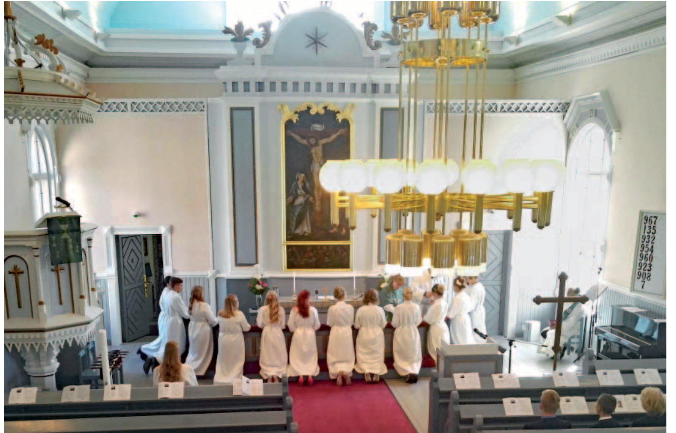
Rippikoululaisten yhteinen ehtoollinen syventää seurakuntayhteyttä. Kuva on viime kesän konfirmaatiosta.

Ehtoollisen lisäksi Suuri Ihme -rippikoulusuunnitelma painottaa sitä, että nuoret saavat olla vaikuttamassa rippikoulun sisältöön.